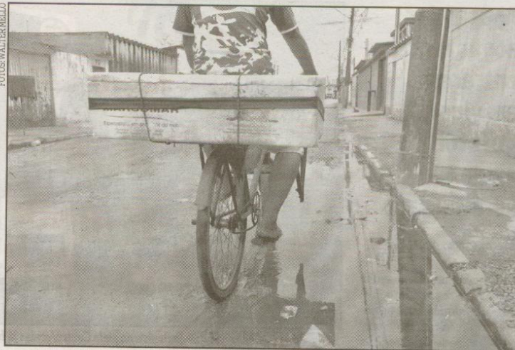
Pavimentação é a principal reivindicação dos moradores, cansados da lama nas ruas de terra